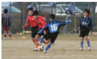
「JC旗サッカー大会」 スポーツを通じての青少年育成事業