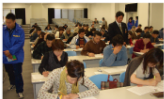
「させほ検定試験」 郷土愛を育む事業