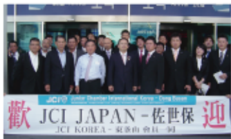
「JCI KOREA 東釜山交流」 姉妹締結をしているJCI東釜山との交流事業