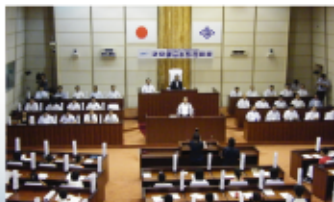
「子ども市議会」 子どもが未来のまちを考える事業