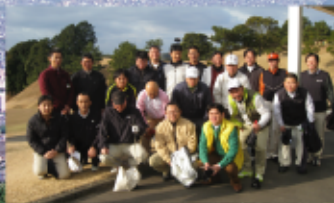
「じゃがいも」 初心者から参加できるゴルフクラブ