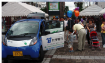
「地球環境事業」 地球の環境を考える事業