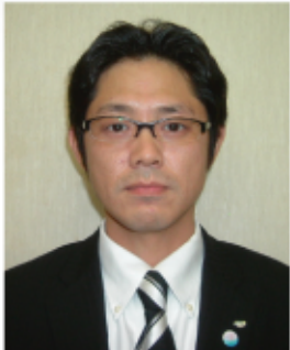
社団法人 佐世保青年会議所 第56代理事長