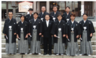
「祈念式・壮年式」 メンバーの厄入り・厄晴れ祈願