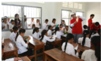
「GTS事業」 海外での活動を通して自己修練を行う事業