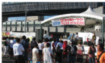
「第4回佐世保シーサイドフェスティバル」 市民交流事業の一環として夏のイベントを開催