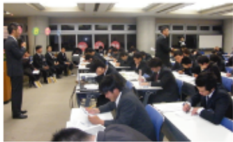
「例会」 全メンバーが参加する月に一度の例会